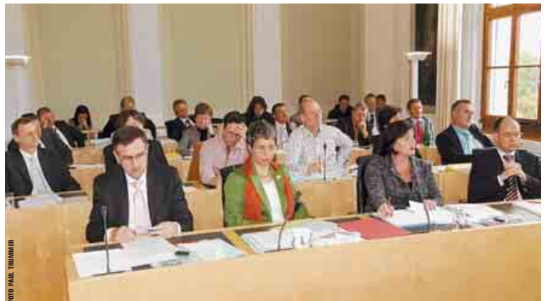
Mit deutlicher Mehrheit stimmten die Volksvertreter einer Petition von Amnesty International Liechtenstein und einer Motion der Freien Liste zu. Wer wie gestimmt hat, lesen Sie auf Seite 3.